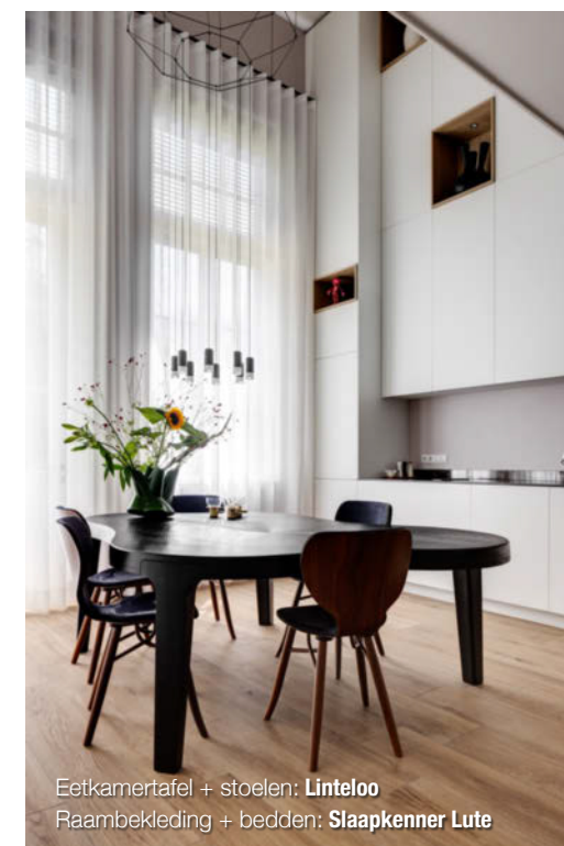
Eetkamertafel + stoelen: Linteloo Raambekleding + bedden: Slaapkenner Lute

gespoten heeft dit materiaal een zowel stoer, als zachtvaardig karakter gekregen. Het frame is ingelegd met glas zodat maximale veiligheid en lichtinval bereikt worden. Doordat de ramen zes meter hoog zijn is het uitzicht vanaf de loft net zo heerlijk als wanneer je beneden in de keuken bent. De vide, met op de achterwand de rustgevende kleur Light Blue, is ook de plaats waar de bewoners zich even helemaal terug kunnen trekken. Het hangend dressoir van Bolia aan de voorzijde van de vide dient als thuishkantoor."